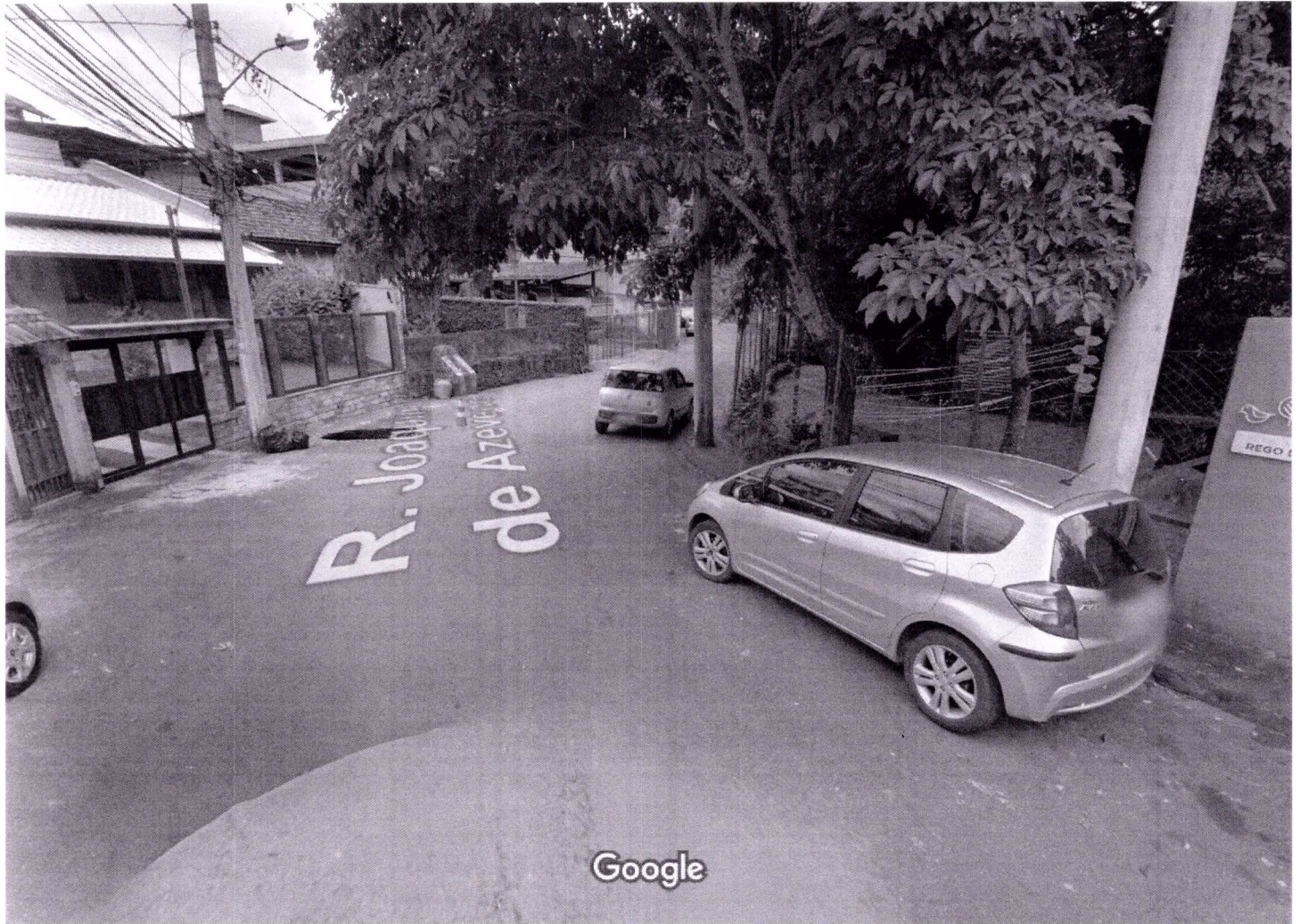
Captura da imagem: mar. 2020